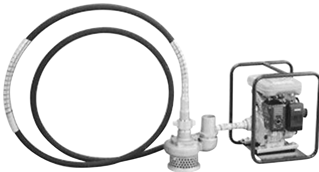
フレキシブルポンプ性能曲線図 EFP80型 (3,400min -1 実測値)