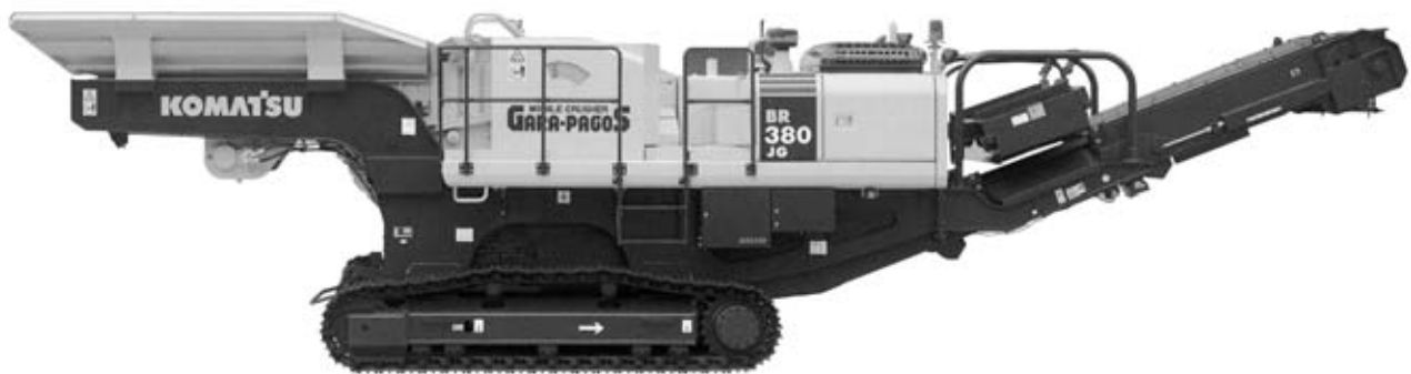
外形図 (単位: mm)

コンパクトなボディにパワフルな破碎力を秘めて。 振動グリズリフィーダ搭載で作業効率がさらに進化。 クラッシャ、フィーダのスピードコントロールで、粒度分布を自在に制御。